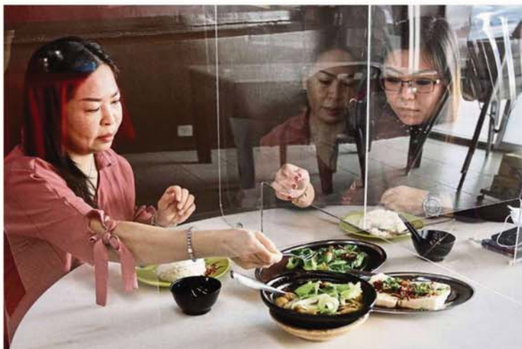
The partitions for restaurants are custom-made to include a small opening to allow food sharing.

"The acrylic screens fabricated in multiple configurations are placed at the 'flexi and