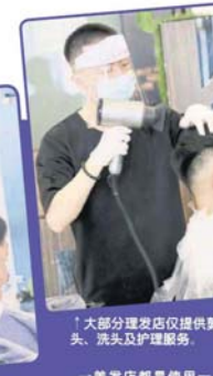
↑大部分理发店仅提供剪头、洗头及护理服务。