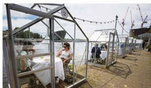
Neelavenen feels the best way to allow customers to dine safely is in glasshouses such as the ones seen here at Mediamatic restaurant in Amsterdam, Netherlands.