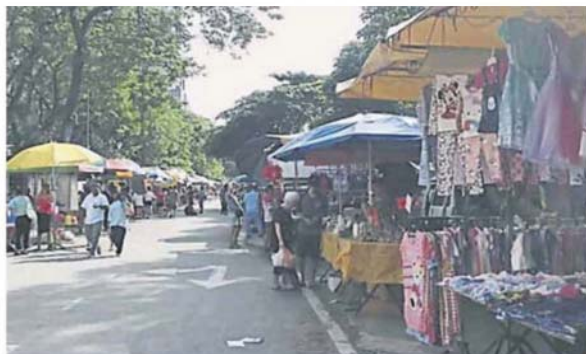
一些地区的早市规模大，逢星期六和日，摆卖摊档超过百个。

“行动管控指令期间，垃圾承包商如常在相关地点进行清洁工作，地方政府须支付固体废物清理费。”