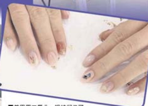
■美甲周三复业, 姐妹们又可以拥有美美的指甲炫耀了。