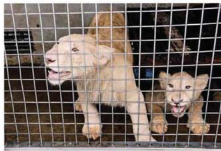
随着动物园重新开放,“新住户”白狮子将与访客会面。

罗斯里指出,动物园原本预计要半年的时间恢复过往的游客量,但看到商场上的人潮,他希望动物园也能够在这段时间内恢复。#