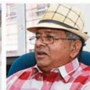
Samson says partitions give a false sense of protection.

Samson said the SOP set by Health Ministry, such as proper sanitising of premises and frequent hand washing, was good enough and there was no need for partitions.