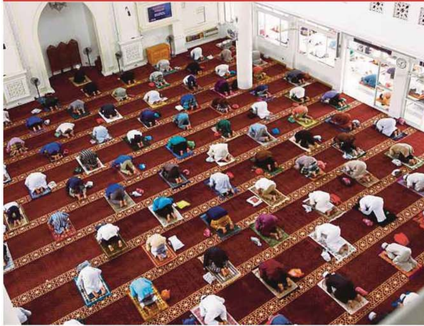
Friday prayers being performed at Masjid At-Taqwa in Paroi, Seremban, last Friday.

Provided for client's internal research purposes only. May not be further copied, distributed, sold or published in any form without the prior consent of the copyright owner.