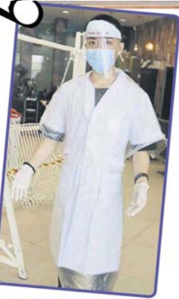
■理发师“全副武装”, 让光临的顾客也可以感到安心。

“我们终于可以开业, 因此会严格遵守政府所规定的标准作业程序, 避免违反又遭关闭。” 业者说, 他们会为顾客消毒、量体温、职员会戴口罩、防护服、只接受预约客, 登记访客资料、保持安全社交距离等。 同时, 理发店暂可以理发、洗发及护发服务, 其它服务, 例如染发、烫发等由于必须在1小时内完成, 而且政府是临时亮绿灯, 因此大部分理发店今天还没有提供染、烫服务。