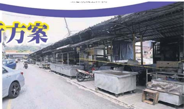
雪州的早市巴刹是否可在6月15日复工,仍待敲定。