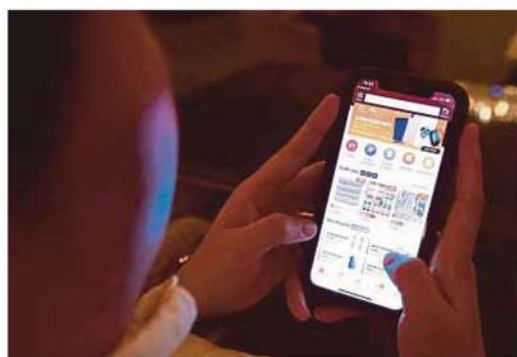
Aktiviti membeli-belah dalam talian antara inovasi digital yang mampu merangsang ekonomi selepas terkesan dengan COVID-19. (Foto hiasan)

Yang pasti, COVID-19 membuka laluan untuk transformasi digital kerana perniagaan terpaksa menghadapi cabaran baharu daripada penutupan ruang fizikal, pergerakan terhad dan gangguan bekalan.