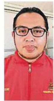
祖斯尼: 获准离开管制区的无冠病本国人,依然不能跨州。

←瓜冷县卫生署于9日在脸书专页贴文,呼吁筛检结果为阴性的本国人,可到筛检帐篷索取放行证供出入管制区。